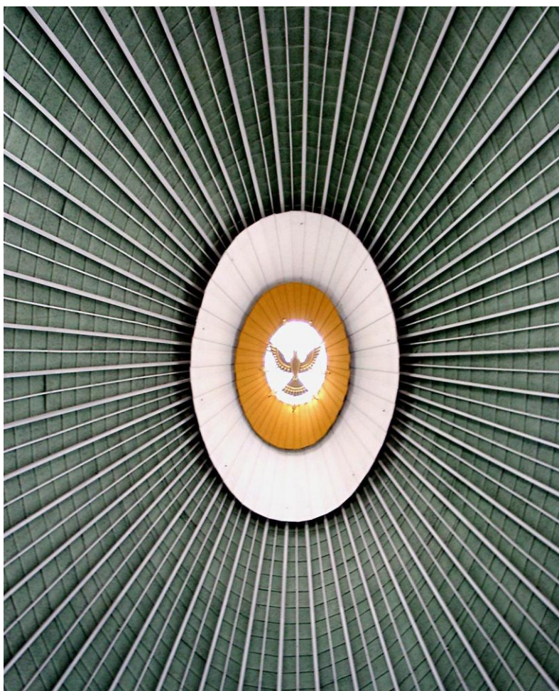
Bild: Architekt: Hans Schädel